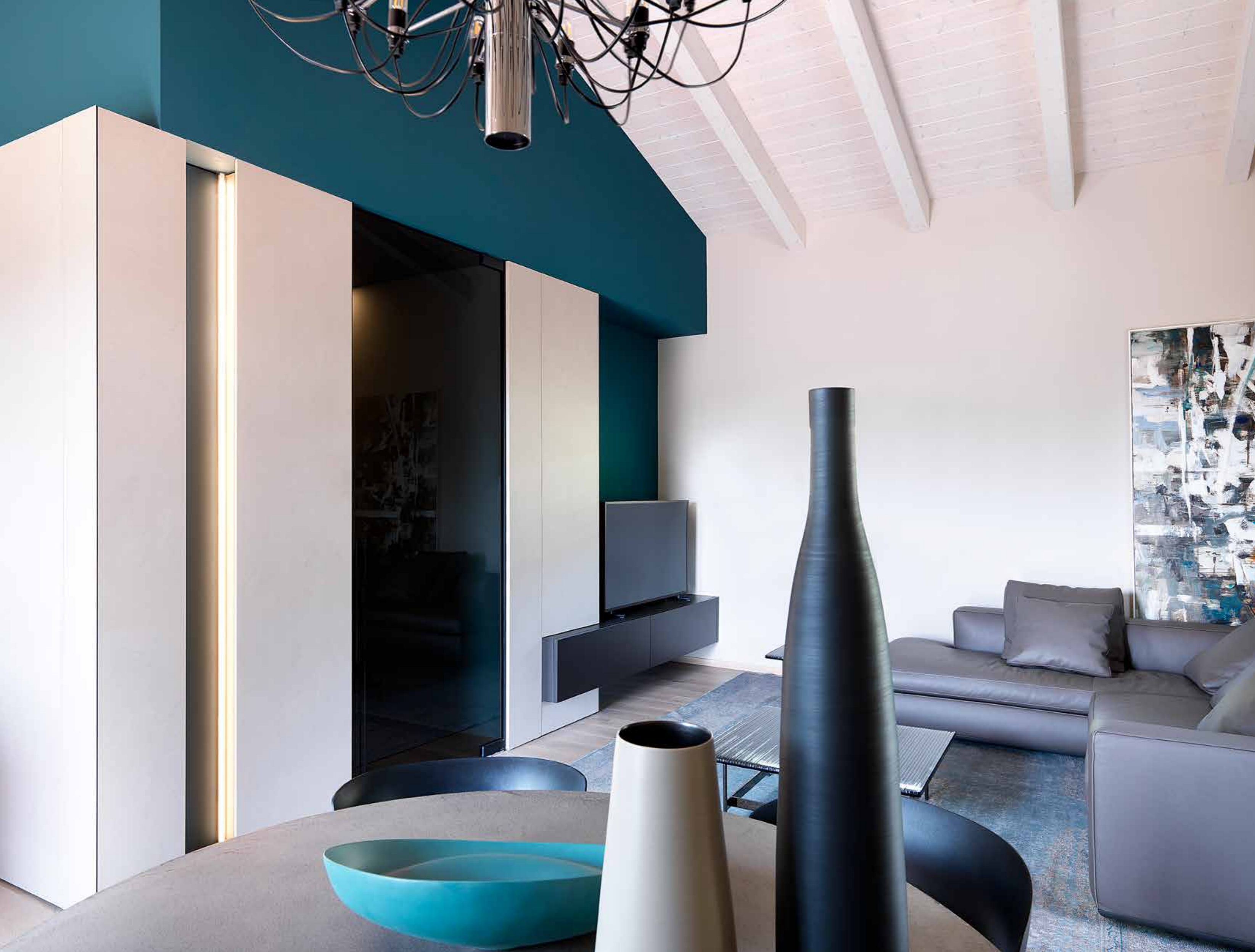
Inquadratura dello spazio living: gli arredi si integrano all'ambiente in un luminoso unicum visivo. Di fronte al divano in pelle fango, nella composizione con contenitori a colonne e area TV, realizzata a misura, si inseriscono con eleganza la porta in vetro fumé che oscura l'accesso alla zona notte e lo scenografico taglio di luce con barra a led. In primo piano, tavolo da pranzo in pietra di tufo con sedie Koki in polipropilene nero ( Far Arreda, Roncadelle - Bs ).