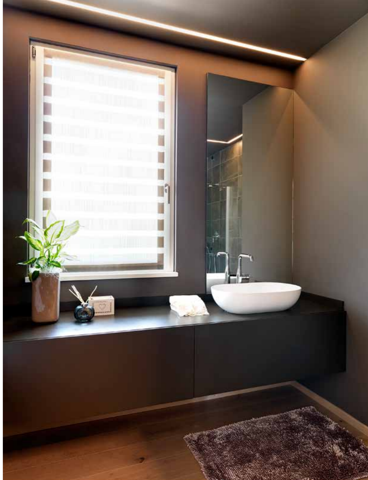
Nel bagno padronale arredo moderno e raffinato: a tutta parete, mobile sospeso laccato antracite, inquadrato da una luminosa barra a led ( Far Arreda ).