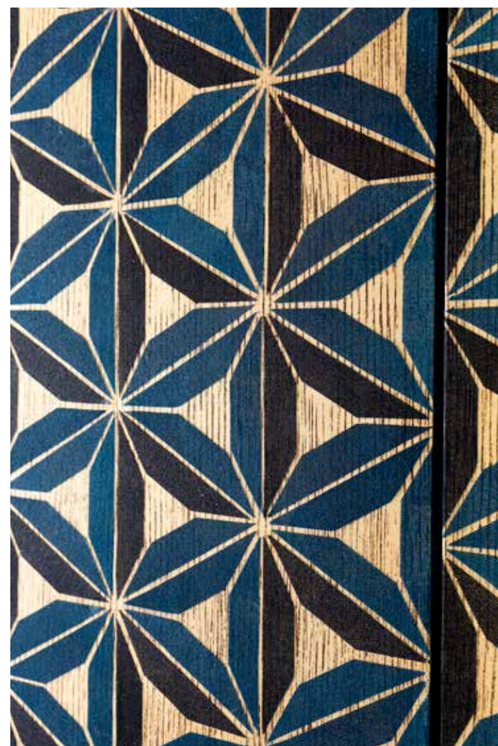
Nella camera padronale armonia di grigi in un elegante stile moderno: di fronte al letto in pelle nuvola, armadio a tutta parete, realizzato su misura ( Far Arreda ). Accanto: dettaglio decorativo, sinonimo di fantasia e vivacità.