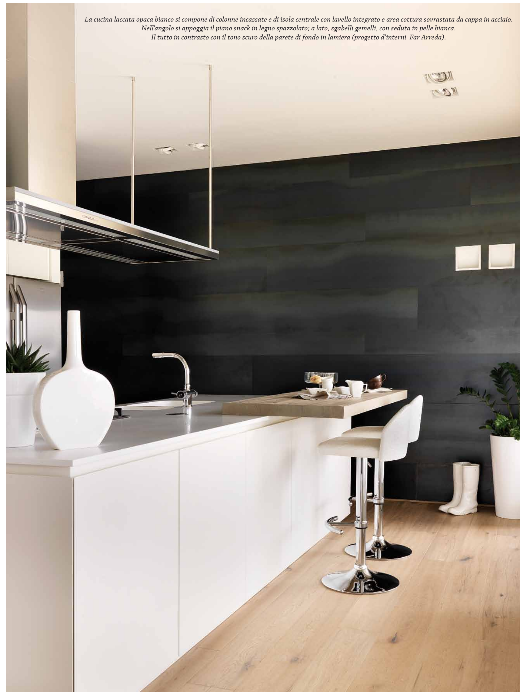
La cucina laccata opaca bianco si compone di colonne incassate e di isola centrale con lavello integrato e area cottura sovrastata da cappa in acciaio. Nell'angolo si appoggia il piano snack in legno spazzolato; a lato, sgabelli gemelli, con seduta in pelle bianca. Il tutto in contrasto con il tono scuro della parete di fondo in lamiera (progetto d'interni Far Arreda).