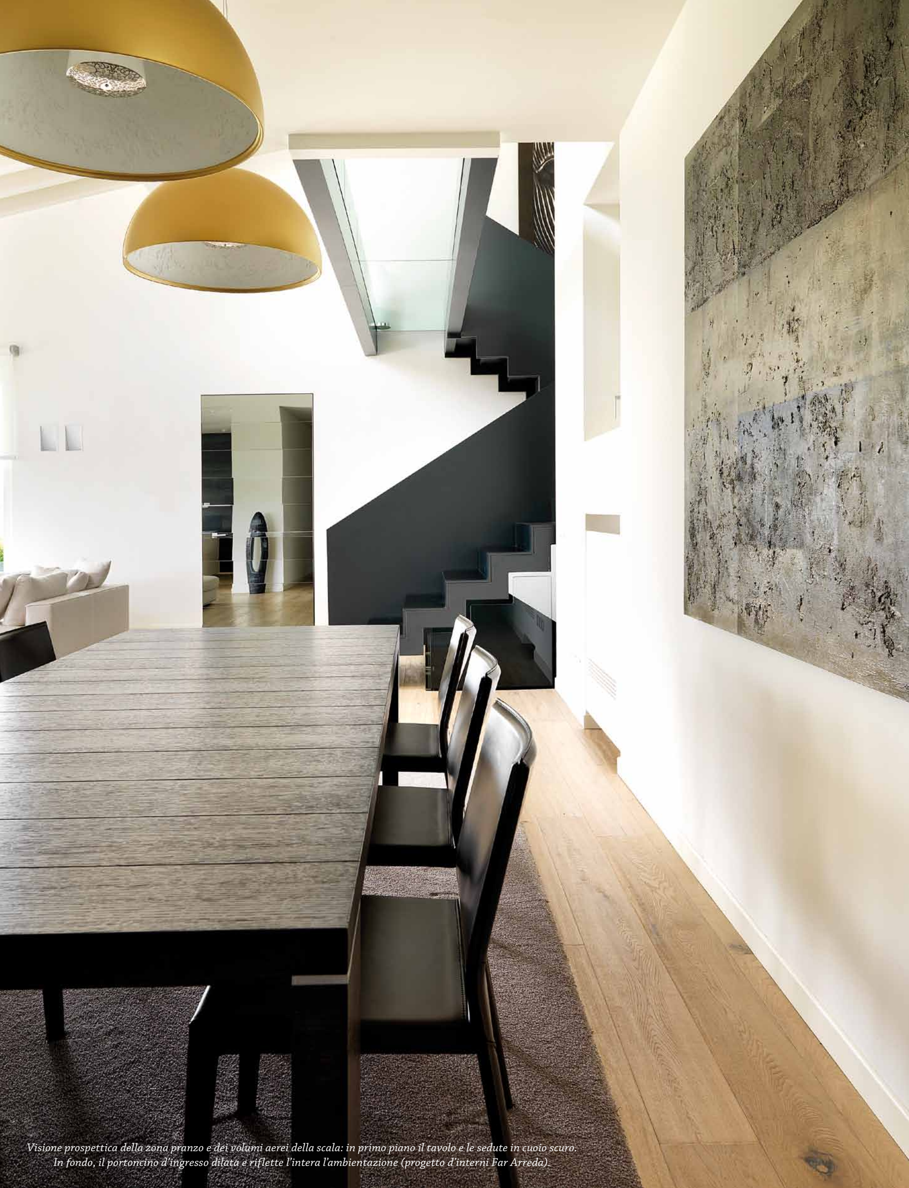
Visione prospettica della zona pranzo e dei volumi aerei della scala: in primo piano il tavolo e le sedute in cuoio scuro. In fondo, il portoncino d'ingresso dilata e riflette l'intera ambientazione (progetto d'interni Far Arreda).