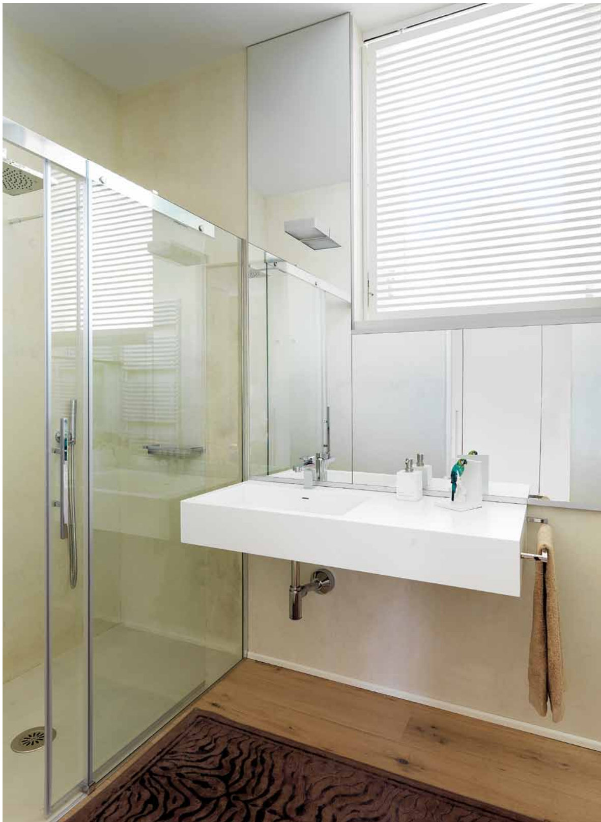
Bagno elegante e luminoso, con lavandino minimale sospeso e maxi doccia con rivestimento interno in resina. Uno specchio incornicia la finestra (progetto d'interni Far Arreda).

Far Arreda progetto d'interni via Martiri della Libertà, 23 Roncadelle Bs tel 030 2780270 fararredamenti.com info@fararredamenti.com