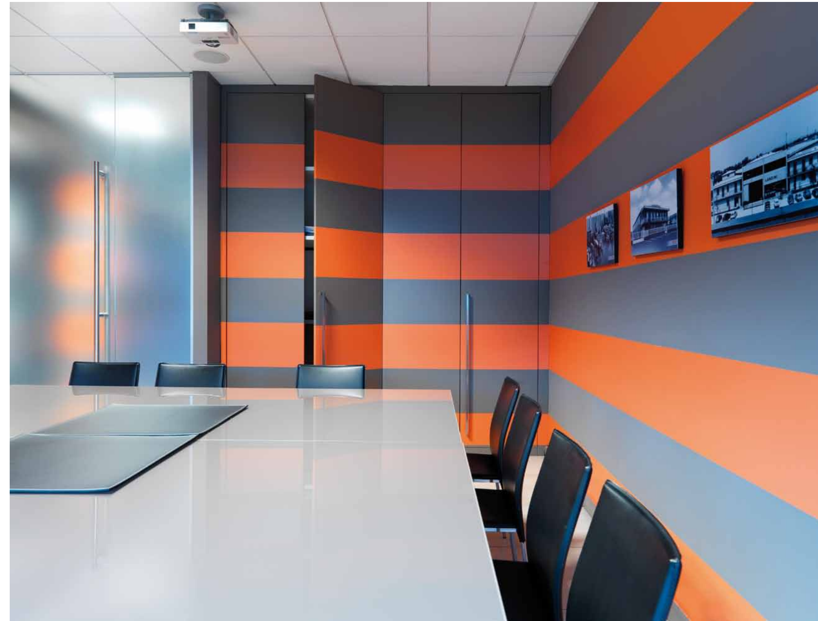
Una delle sale riunioni, organizzata con tavolo in acciaio e piano in cristallo laccato tortora e sedie grigio antracite in cuoio. La finitura della parete, a righe arancione e tortora, coinvolge anche le ante degli armadi, visibili sullo sfondo sempre di Far Arreda.