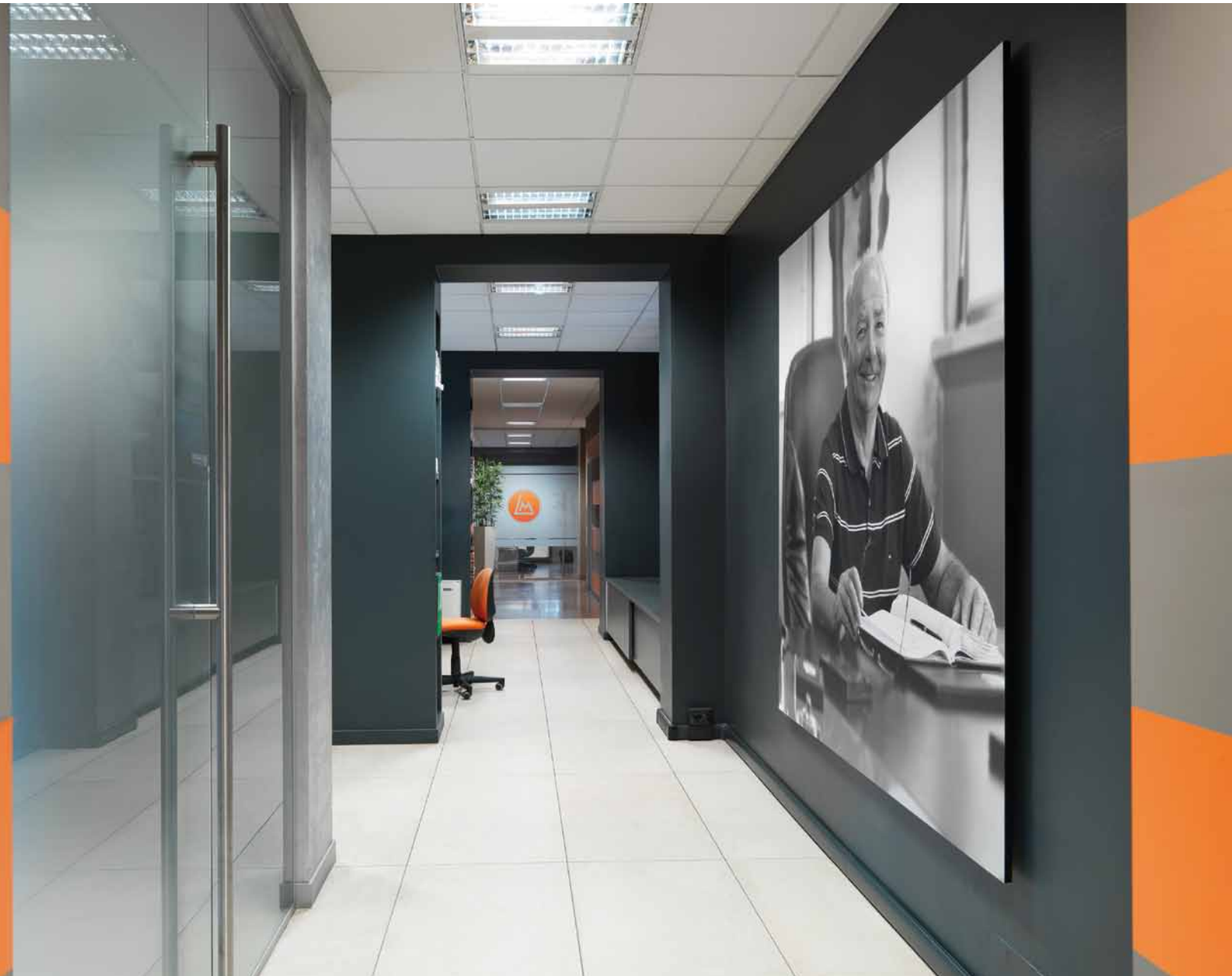
Inquadratura del lungo corridoio, realizzato distribuendo in diverse modalità il colore arancione, rappresentativo dell'azienda committente; la gigantografia alla parete è un omaggio al fondatore dell'azienda; a sinistra, la porta d'ingresso di una delle sale riunioni (tutto Far Arreda).